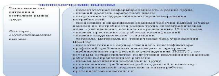
Рис. 1. Экономические вызовы и факторы, обуславливающие эти вызовы, Николаевской области.

Вызовы экономики и факторы, обуславливающие эти вызовы, все это нужно учитывать в деятельности профессионально-технических учебных заведений Николаевской области (Рис. 1).