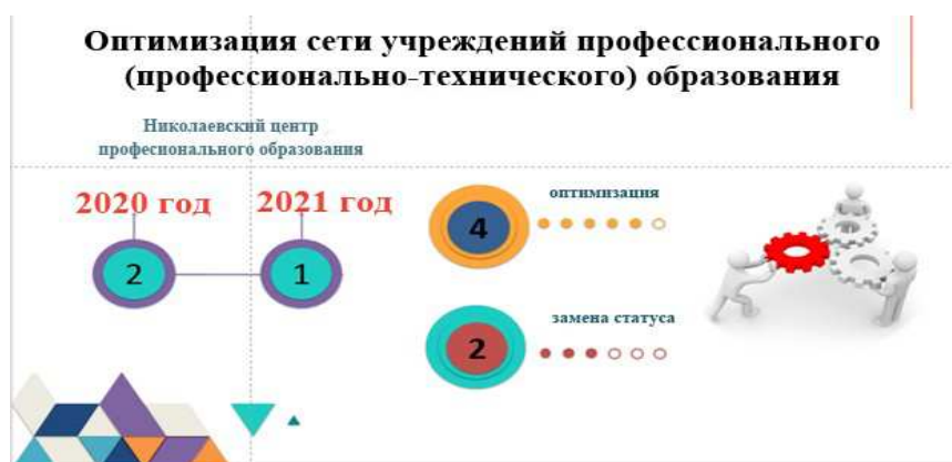
Рис. 3. Оптимизация сети учреждений профессионального образования Николаевской области.

содержания учебных программ), участие работодателей, специалистов по производству в разработке различных проектов, их апробации и внедрении, в работе государственных квалификационных комиссий, в организации и проведении конкурсов профессионального мастерства [4].