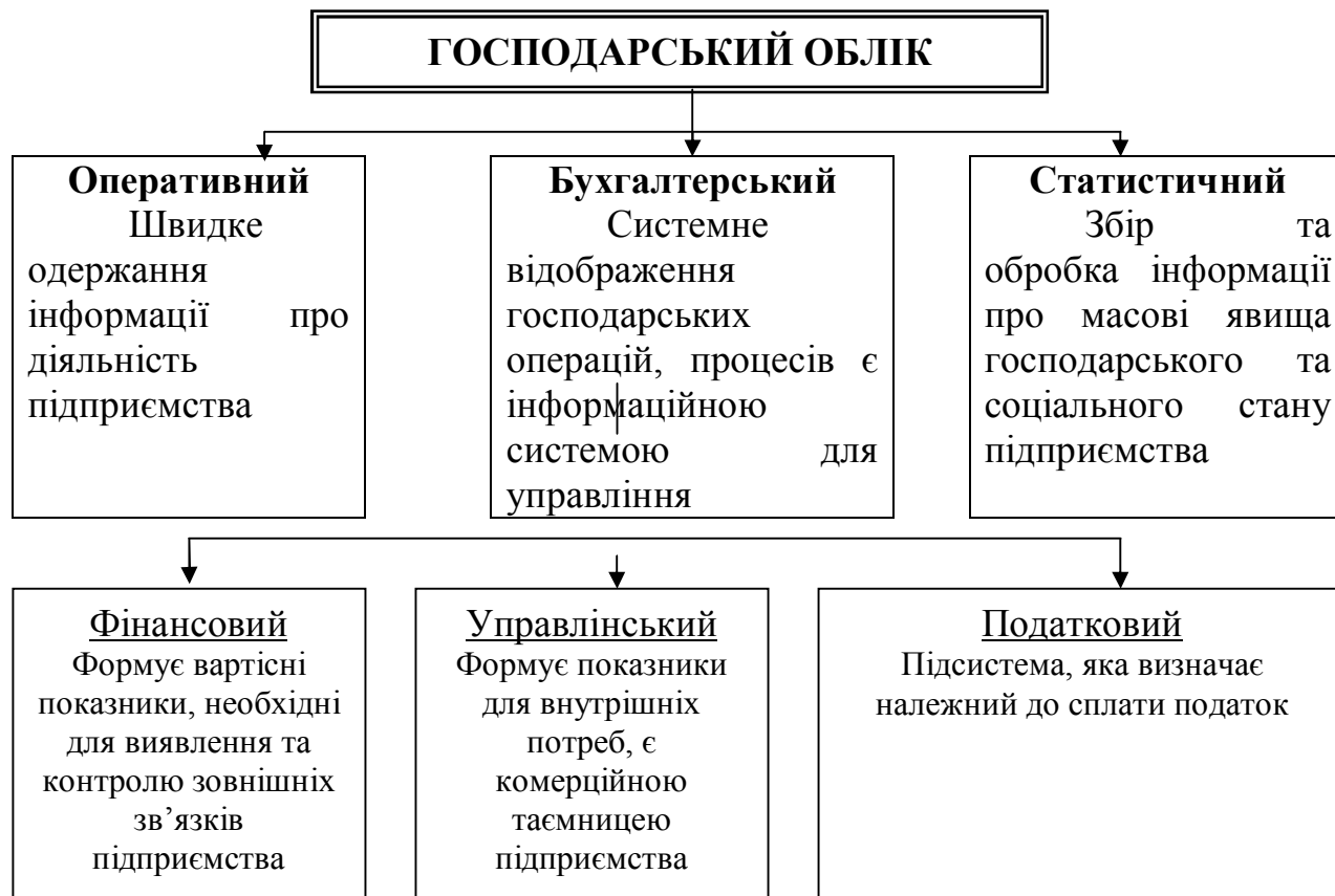
Рис.1.1. Види господарського обліку

продукції, потужність і використання обладнання, виконання норм виробітку та інше. Особливість: швидкість, оперативність надання даних керівництву. Оперативний облік не є суворо документальним (телефон, усні повідомлення).