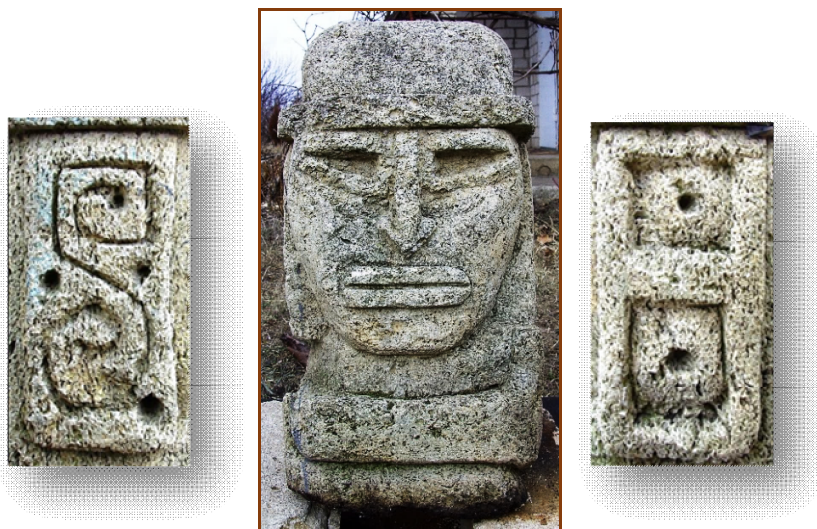
Артефакт з шкільного музею с. Богданівка (Вознесенського р-н)

Між ханом північних монгол Тактою та Ногаєм з монгольському роду Чингізхана 90-х роках XIII ст. почалась ворожнеча в 1297 р. Токта з військом прийшов в південне межиріччя Бога та Дністра знищити Ногая, але був розбитий і тікав за Дон. Ногай був великодушний і не переслідував військо хана. Зібравши величезне військо хан Токта прийшов в Причорноморський степ. Частина війська зрадила Ногая. У 1300 р. Ногая було вбито, у середині його роду виникла міжусобиця. У 1301 році востаннє згадується Країна Асів. Знахідки частини стели з головою знатного монгола на його могилі поряд з Гардом відголосок подій тієї