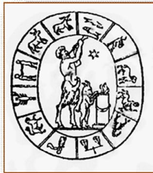
Монета античних козаків Північного Причорномор'я та Криму [44, с.110]

Враховуючи, що Різдво Христоове одні з перших християни вірмени святкують на день раніше інших, то за Григоріанським календарем дивним чином святвечор Різдва Христового, день Благовіщення та день Івана Купали збігаються з днем