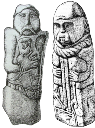
Запорозжці (баби) IVст. до н.е.