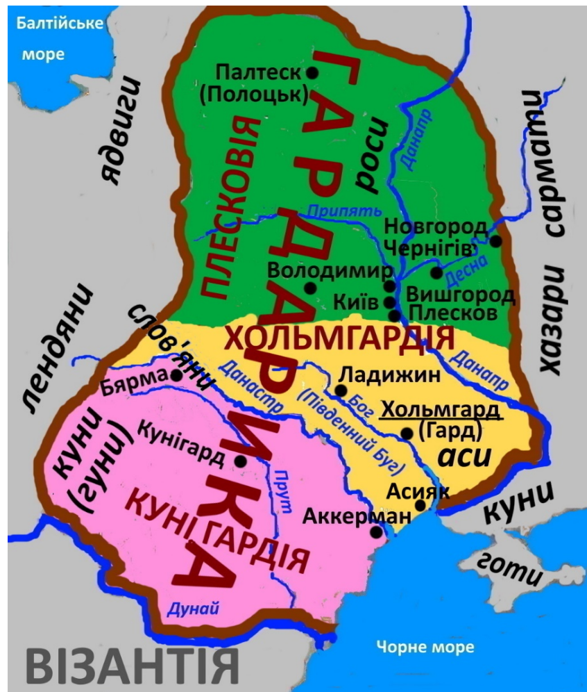
Середньовічна держава часів правителя Володимира

Навала монголо-татарської орди на міста середньовічної держави Гардарики примусила шукати спасіння від знищення в непролазних хащах Сарматії. Вихідці з міст Руси створювали нові поселення. Таким чином в Московщині з'явилися: Новгород (великий та нижній), Володимир, Ладизин (трансформований в Ладогу), Переяслав (трансформований в Переслав-Залеський). Коли король Олександр в 1250 р. заслав з Хольгарду сватів до шведського короля Хокона IV, той йому відмовив, посилаючись на залежність його земель від монголо-татар [53, с.265.266]. Інша частина населення рятувалась від татар за Прутом в лісистих горах Карпатах. Так захопленого болгарами юнака було продано на невільничому ринку, який в 1260 р. став султаном Єгипту, відомий в історії, як Бейбас I - аль-Малік аз-Захір Рукн ад-Дін Бейбарс аль-Бундукдарі ас-Саліх(1223-1277) [33, с.351]. Дякуючи міжусобиці монгольського правлячого роду, в 70-80-х роках XIII ст. в північно-західній частині Причорномор'я Ногаєм створюється союзницька держава, де в південному межиріччі Дніпра та Дністра свою автономію отримує Країна Асів [51, с.116,117]. Султан Бейбарс для створення надійної своєї армії посилав з Єгипту до Північного Причорномор'я кораблі наймати юнаків-земляків [30, с.163,164], де мав стійкі дружні зв'язки з Ногаєм та правителем Країни Асів. Таким чином, формувалась армія мамлюків. Згодом мамлюки отримали землі, чини, привілеї. Таким чином, формувалась майбутня еліта в Сирії та Єгипті.