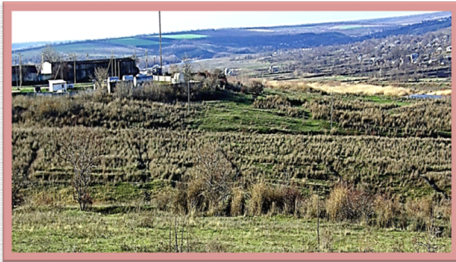
Місце городища Гард II на східній околиці с. Богданівка (Вознесенський р-н)

Козацьку церкву Покрова Пресвятої Богородиці, яка знаходилась на Гардовому острові і була символом віри, біля якої збирались гайдамаки з Бого-Гардової паланки захищати православну віру в Польській Україні 1768 року, за дозволом генерала Текелі було перевезено в Катерининський шанець (нині Первомайськ), яка була відома під назвою Св. Варвари [59, с.280]. В 1959 р. автор цих рядків бачив її в Первомайську, зовні обшитою широкими дерев'яними не пофарбованими дошками, почорнілими від часу, поряд з мостом в гирлі ріки Синюхи. У 60-х роках ХХ ст. її розібрали і встановили в селі Кумари. У 2001 р. довелось переконатись, що Гардова церква, побачена в Первомайську, знаходиться в селі Кумари, яку оббили вагонкою та пофарбували.