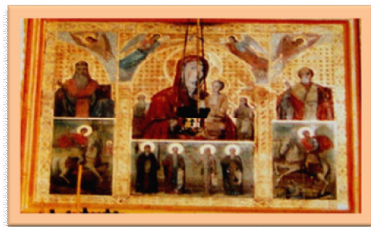
Гардова церква в с. Кумари. Викрадена храмова ікона запорожців.

Представлена оглядова стаття про найвагомші моменти історії регіону Миколаївщини, до феодальної пори правління російською імперією, наочно показує, що існуюча історіографія України, в тому числі Миколаївщини, різко відрізняється від наукових методів досліджень історичного минулого і фактично є політичною та ідеологічною міфологією зомбування населення. Звідси краєзнавчі експозиції місцевих музеїв залишаються ідеологічними носіями могутності російської імперії. Постає генерала-головоріза Олександра