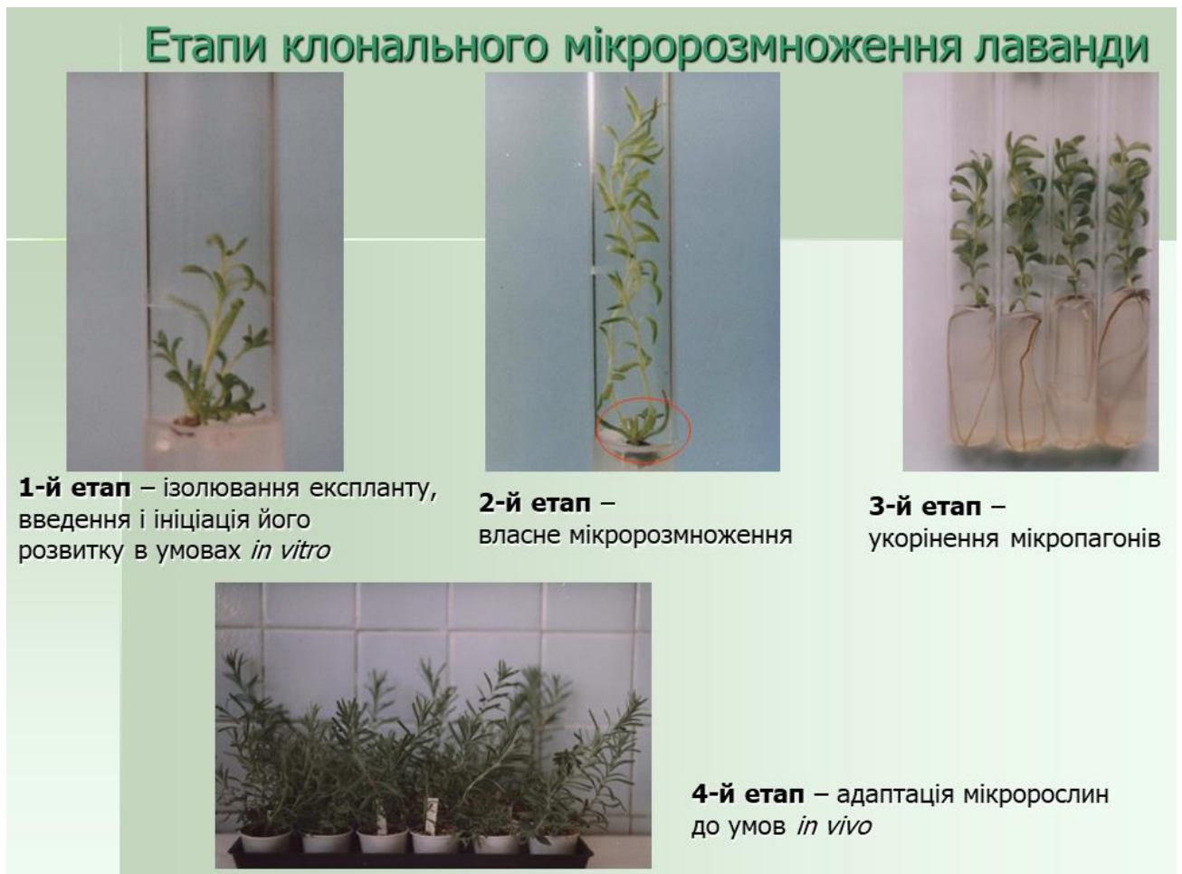
Рисунок 4 – Етапи клонального мікророзмноження рослин (на прикладі лаванди вузьколистої)