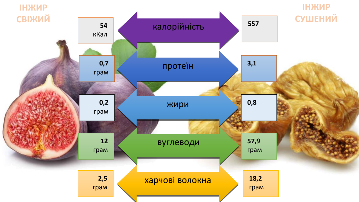
Рис. 2. Харчова цінність в 100г інжиру

В сушених плодах інжиру вміст мінеральних речовин може сягати 3%, що майже в 2-4 рази вище ніж у більшості інших фруктів та овочів. При цьому сушений інжир ще багатий на залізо, мідь, фосфор і магній.