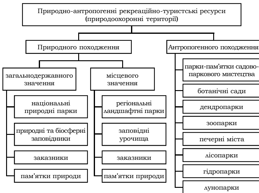
Рис. 1. Структура природно-антропогенних рекреаційно-туристичних ресурсів

До таких територій та об'єктів належать зони антропогенних ландшафтів біосферних заповідників, національні природні парки, регіональні ландшафтні парки, ботанічні сади, дендрологічні та зоологічні парки, парки-пам'ятки садово-паркового мистецтва та ін. (рис. 1).