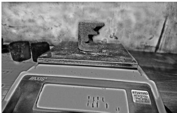
Рис. 2. Ґрунтовий зразок після експозиції.

Стійкість ґрунту до руйнації у повітряно-пиловому потоці (VS) знаходили через відношення маси ґрунту після експозиції (рис. 2) в установці впродовж 3 хв (а) до його початкової маси, у відсотках.