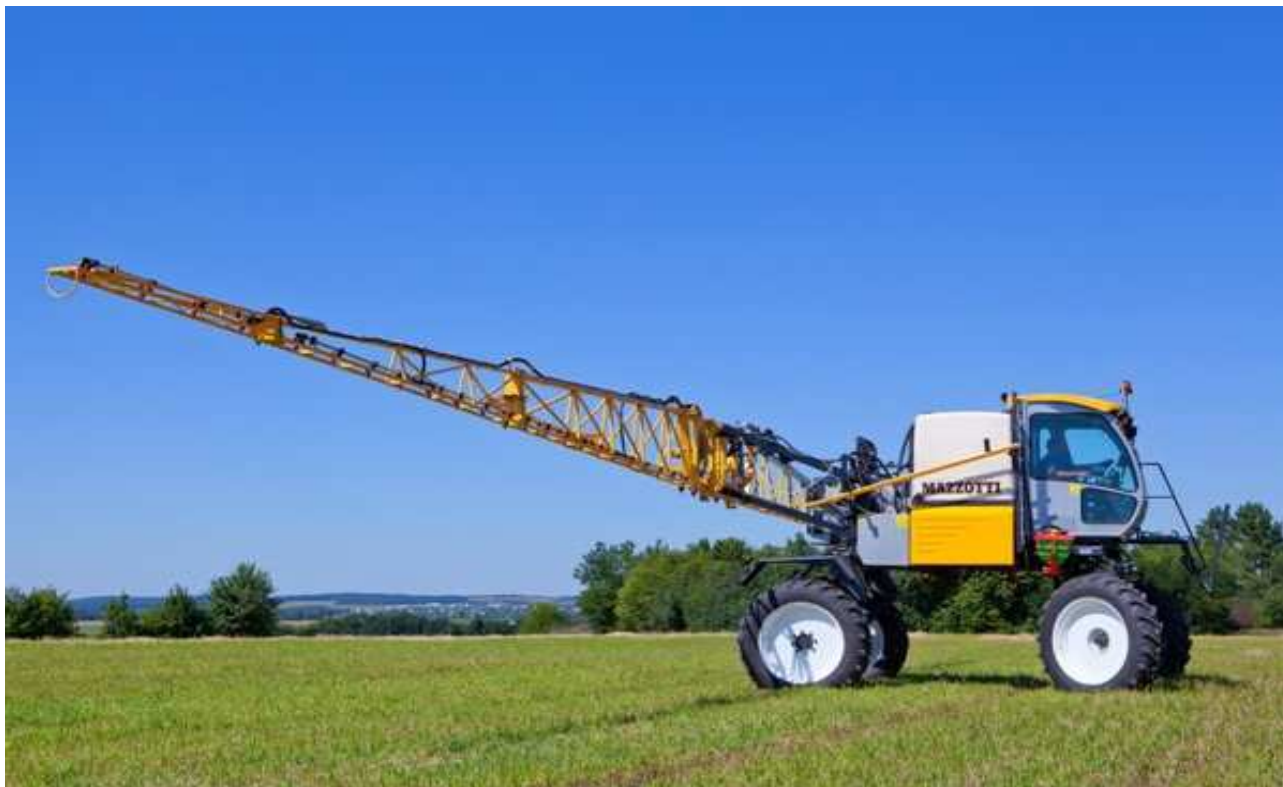
Рис.1.3 Обприскувач самохідний IBIS-3000-24

Досліди ДУ ІСГСЗ показали, що десикацію слід проводити, коли у 50-60% рослин кошики пожовтіли, 20-30% – з бурими краями і у 10-20% – бурі при середній вологості насіння 25-35%. Застосування десикації в більш ранні строки призводить до недобору врожаю, тому що препарати (особливо реглон) через 3 дні гальмують накопичення олії і підвищення маси насіння.