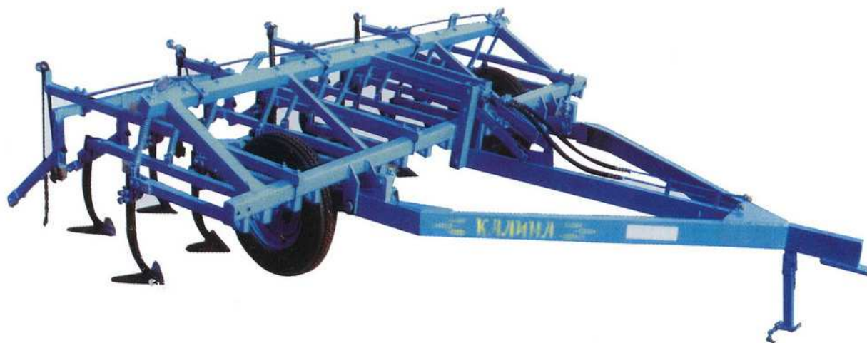
Рис.1.1. Культиватор КПСП-4

На вирівняних полях можна обмежитись однією передпосівною культивацією на 6-8 см.