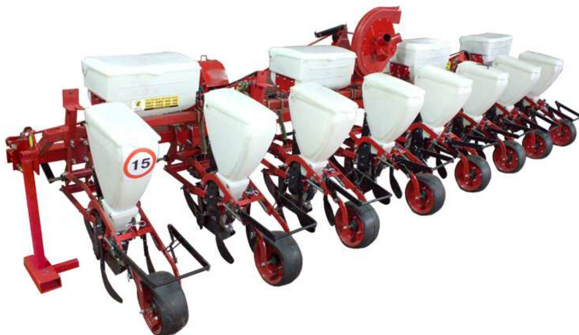
Рис. 1.2. Сівалка СУПН-8

см. У фазі цвітіння цей процес уповільнюється і до її кінця припиняється. Цвітіння кошика триває 10-12 діб, а найбільш інтенсивний його ріст спостерігається протягом 8-10 діб після цвітіння. Налив насіння триває 30-40 діб після запліднення.