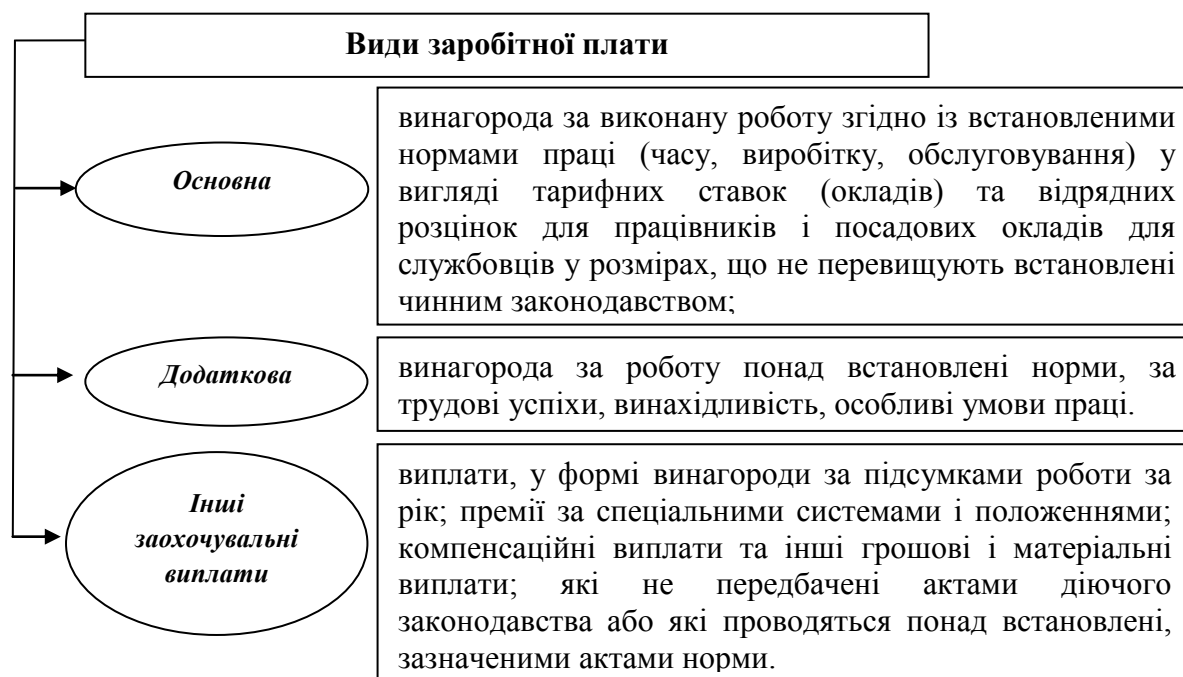
Рис. 2. Структура заробітної плати