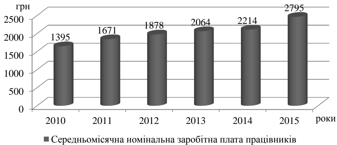
Рис. 3. Середньомісячна номінальна заробітна плата працівників зайнятих у сільському господарстві, 2010-2015 рр.

максимальним розміром не обмежується. Отже, враховуючи вищезазначене, проведемо аналіз рівня заробітної плати у Миколаївській області (рис. 3).