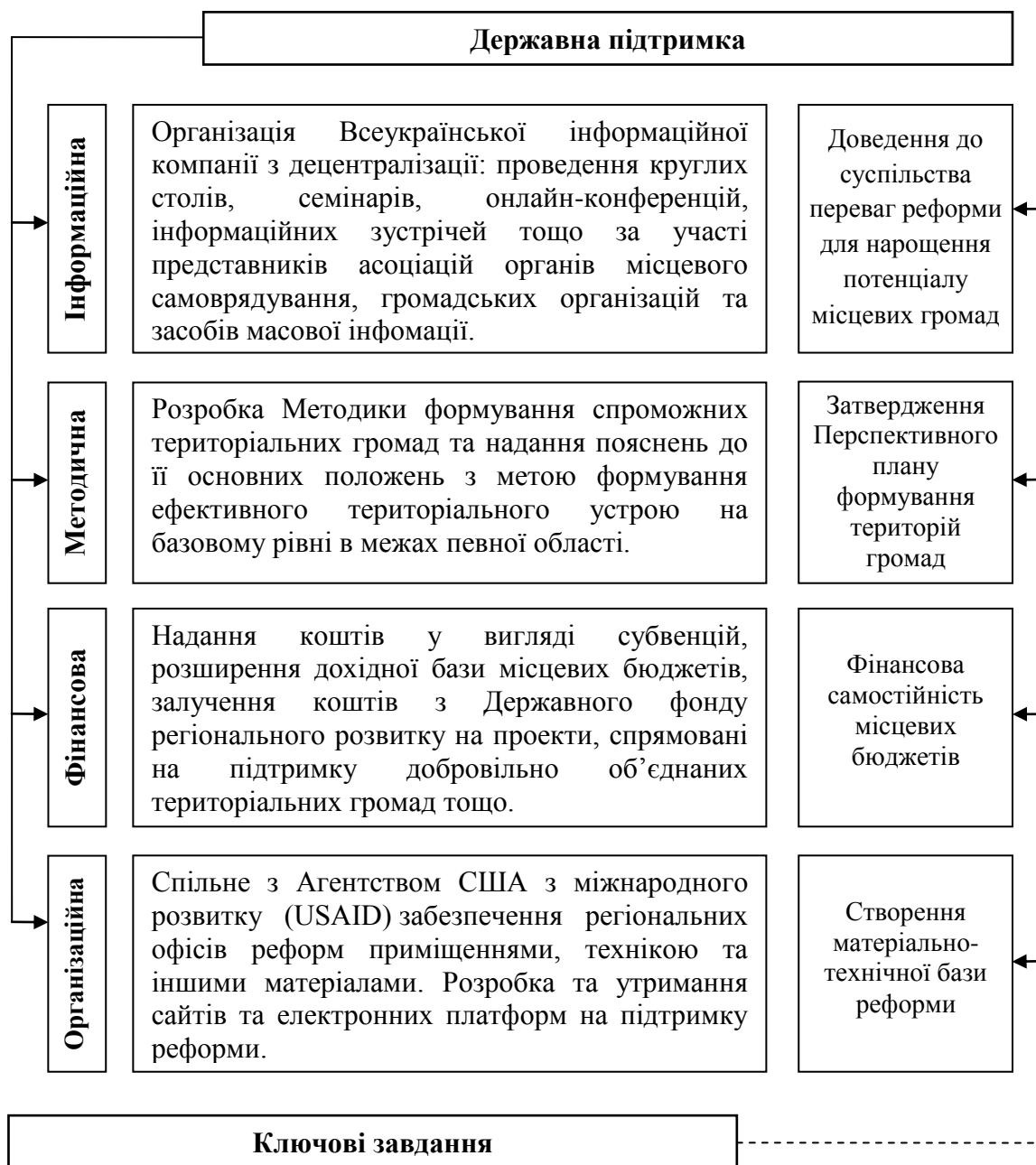
Рис. 1 Форми державної підтримки добровільного об'єднання територіальних громад

кодексу України та деяких законодавчих актів України щодо податкової реформи» змінено структуру місцевих податків і зборів за рахунок відбувається зміцнення фінансової самостійності місцевих бюджетів. До місцевих податків належать єдиний податок (чотири групи, включаючи ФСП) та податок на нерухоме майно, який складається з податку на нерухоме майно та плати за землю [5].