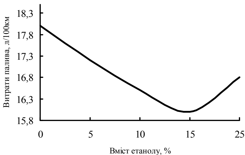
Рис.3. Залежність витрати палива від вмісту етанолу

При додаванні 5-10% етанолу двигун працював стабільно без перебоїв, спостерігалось незначне підвищення температури в двигуні. Збільшення концентрації етанолу призводило до підвищення температури в двигуні, нестабільності його роботи. Проведений експеримент показав зменшення витрати палива (рис.4). Це пояснюється тим, що двигун працював на режимах малих потужностей, коли існують несприятливі умови для сумішоутворення.