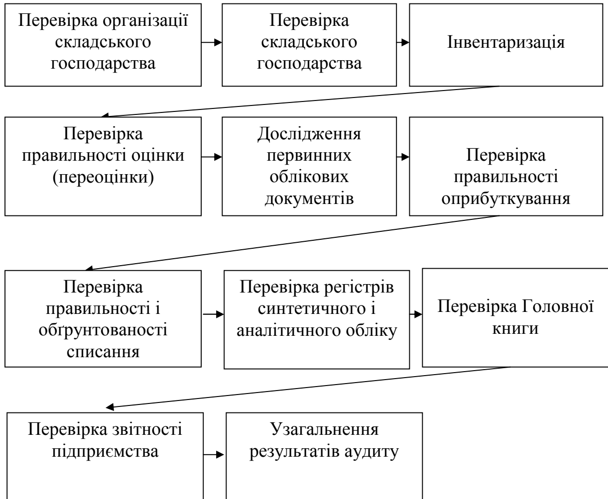
Рисунок 7.1 – Алгоритм аудиту запасів