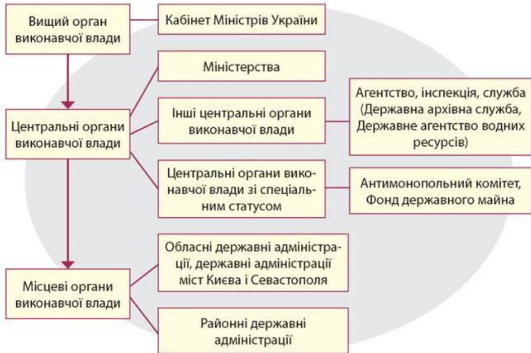
Рисунок 2 – Система органів виконавчої державної влади України

Основними індикаторами, за якими визначають тип регіону: