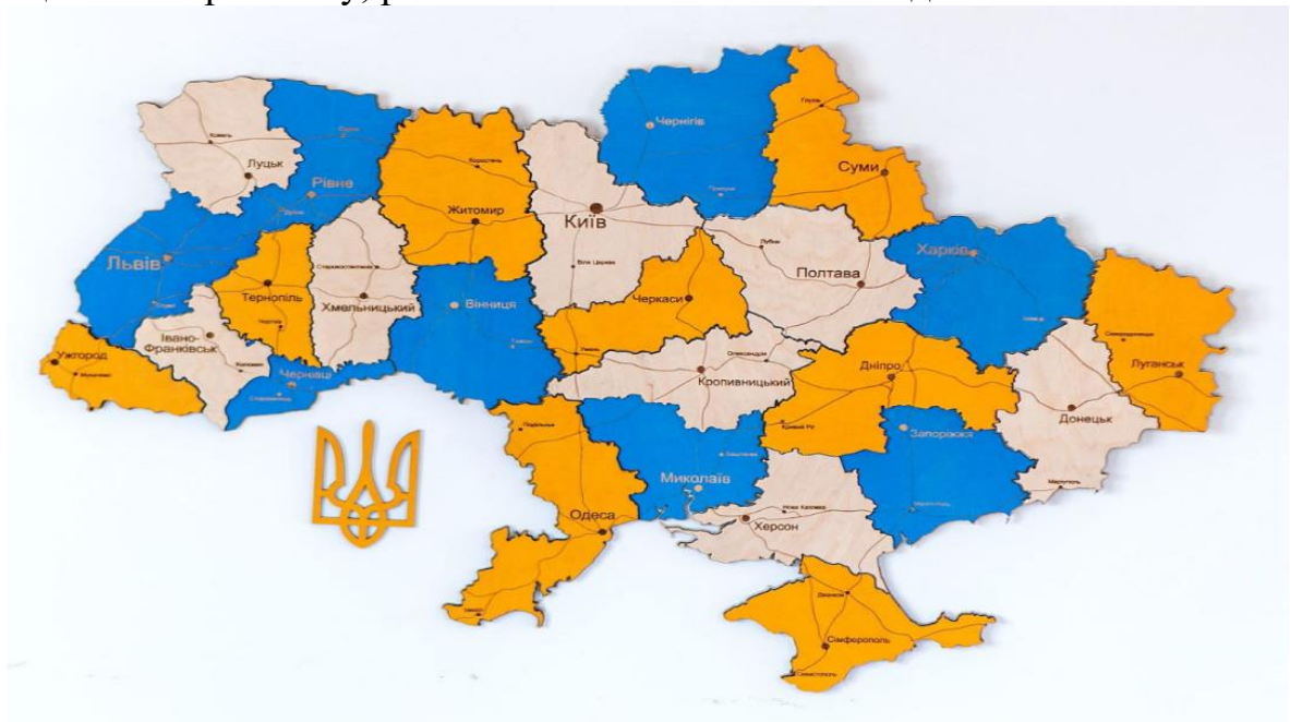
Рисунок 1 – Картографічне відображення адміністративно-територіального поділу України

Усі пропозиції щодо регіонального поділу території України побудовані на використанні принципу , згідно з яким до складу регіону включають певну кількість споріднених областей, які характеризуються приблизно однаковим рівнем природно-географічних, кліматичних умов та певним рівнем показників, що відображають стан економічного, соціального розвитку, рівнем зайнятості та життя людей.