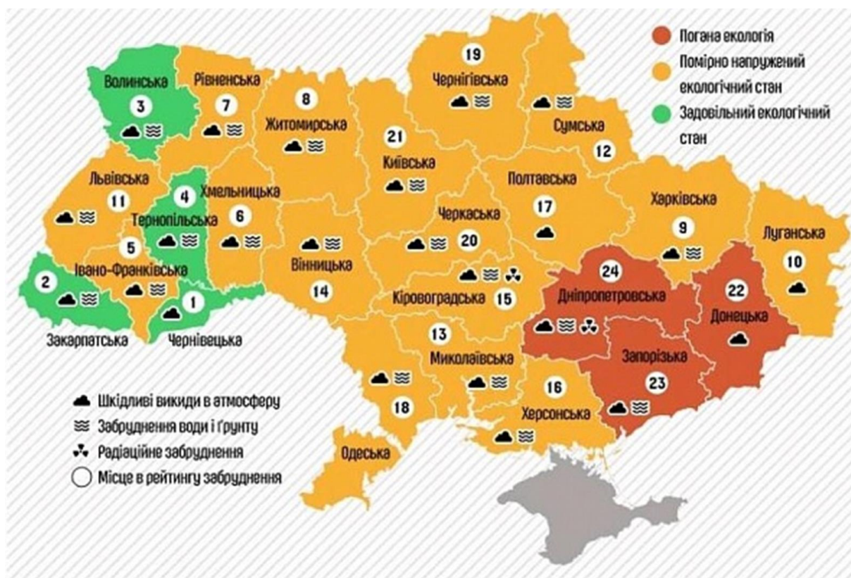
Рисунок 4 – Рівень забрудненості українських областей у 2016 р.

індустріальний потенціал України, однак водночас стали зонами найбільшого екологічного навантаження.