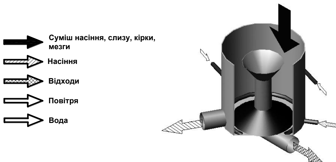
Рис.2. Технологічна схема процесу виділення насіння овоче-баштанних культур

звільняється від слизової оболонки. Клітчаті і кірки, які позбавлені зв'язку з мезгою, добре відокремлюються від насіння в потоці води, що обертається. Поступово насіння осідає на дно і накопичується. Коли кількість насіння доходить до визначеного рівня оператор відкриває запірний клапан і за допомогою напору води звільняє ємність від насіння.