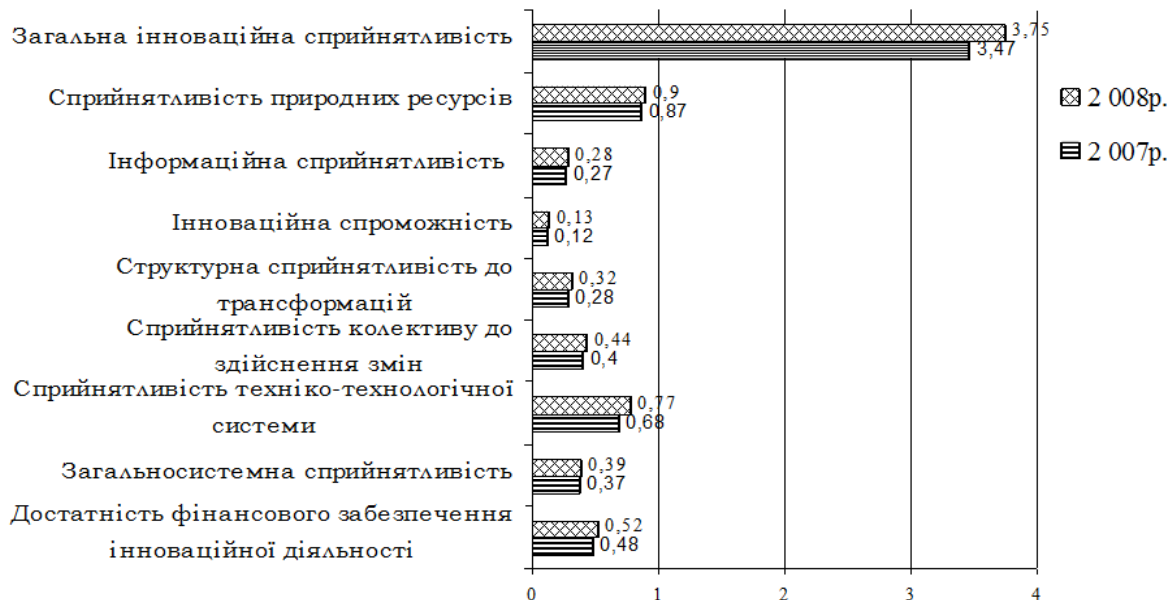
Рис. 3. Загальна та часткова індивідуальна інноваційна сприйнятливість аграрних підприємств (середні дані по 10 аграрних підприємствах Миколаївської області) *

тенціалу суб'єкта господарювання здійснювати як оцінку індивідуальної інноваційної сприйнятливості підприємства, що характеризує всі його підсистеми під кутом можливості реалізації моделі інноваційного розвитку (рис. 3).