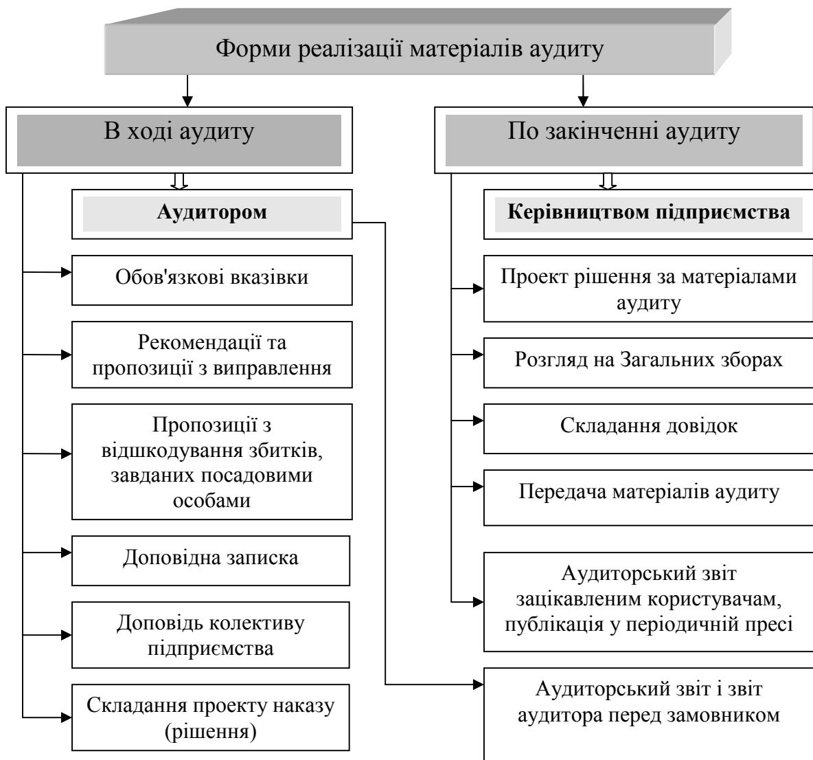
Рисунок 10.1 – Форми реалізації матеріалів аудиту

Проаналізувати форми реалізації матеріалів аудиту (рис.10.1).