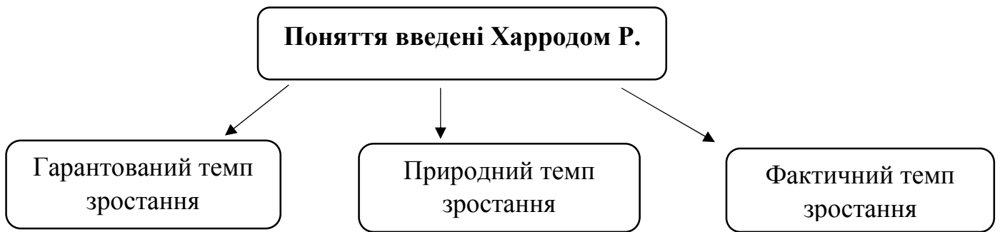
Рисунок 3.1 - Поняття введені Харродом Р.

Завдання 1 (Варіант №1) Дайте визначення понять: