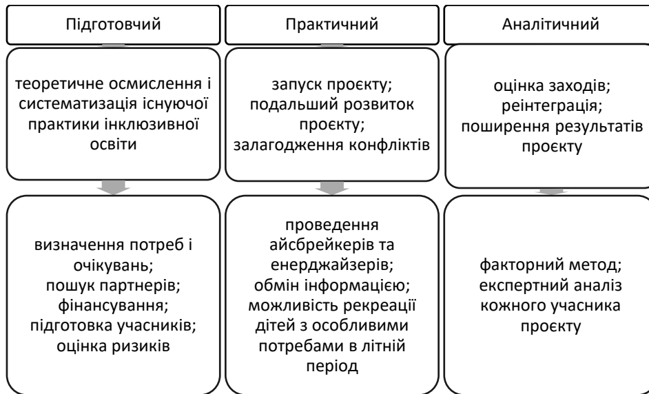
Рисунок 3 – Етапи щодо реалізації ідеї соціалізації молоді з особливими потребами

освіти для отримання максимального ефекту від реалізації та подальшого розширення масштабу соціалізації молоді з особливими потребами (рис. 3)