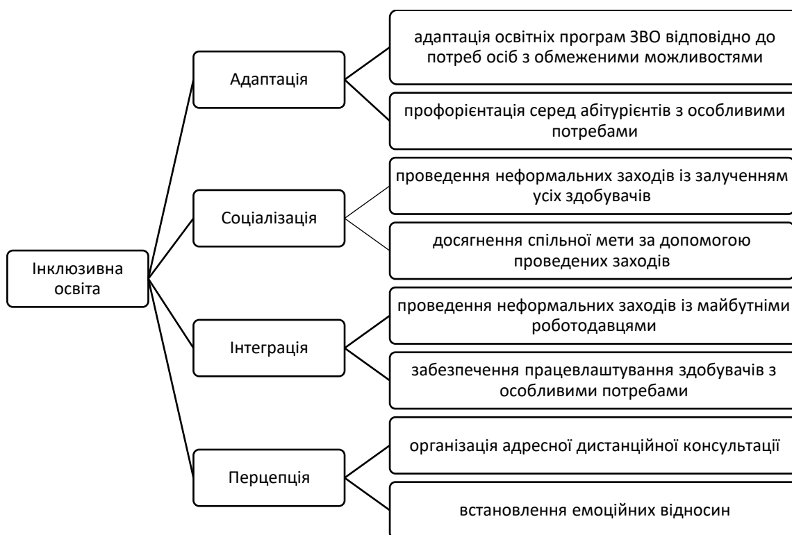
Рисунок 2 – Дерево індикаторів визначених вимог

соціалізація, інтеграція, перцепція через проведення певних заходів (рис. 2).