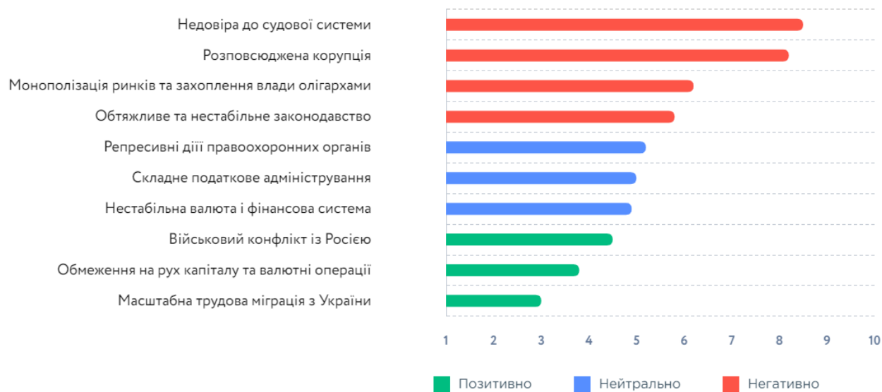
Рис. 1. 2020: Основні перешкоди для іноземних інвестицій в Україну

Графічно основні перешкоди за думкою науковців з European Business Association зображено на рисунку 1.