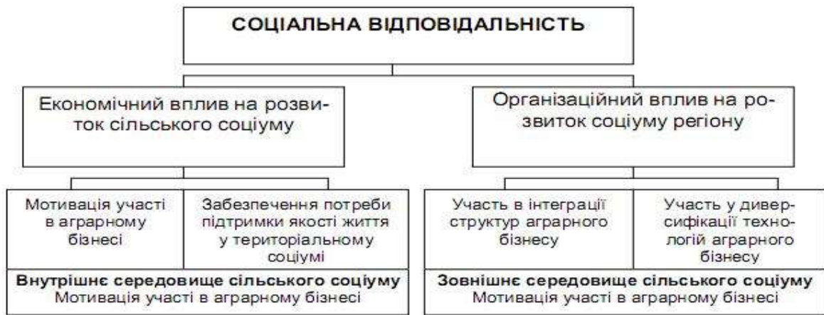
Рис.2 Інструменти реалізації соціальної відповідальності у механізмі соціально-економічного управління розвитком аграрного соціуму