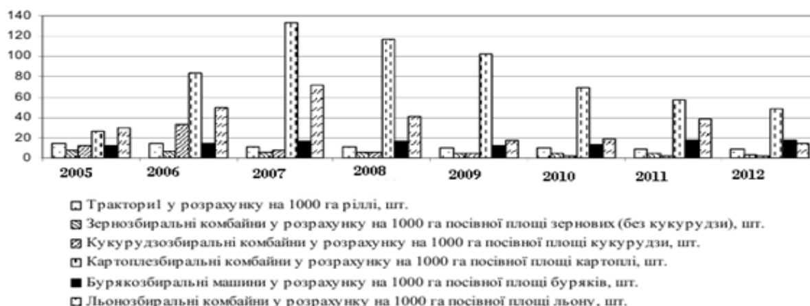
Рис. 2. Наявність сільськогосподарської техніки у розрахунку на 1000 га ріллі або 1000 га посівів окремих культур в динаміці*