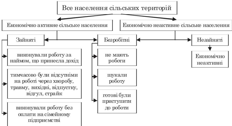
Рис. 1. Розподіл сільського населення України на категорії за рівнем економічної активності, авторська розробка

01.01.2012 чисельність економічно активного населення у віці від 15 до 70 років становила 22056,9 тис. осіб, у тому числі 20247,9 тис. осіб – працездатний контингент. Частка сільського населення в загальній чисельності економічно активних склала 6971,9 тис. осіб, у тому числі 6109,1 тис. – працездатних. Порівняно з 2010 р. чисельність економічно активного сільського населення у 2011 р. зросла на 4,2 тис. осіб, а працездатного – на 17,4 тис. [2, 60–67].