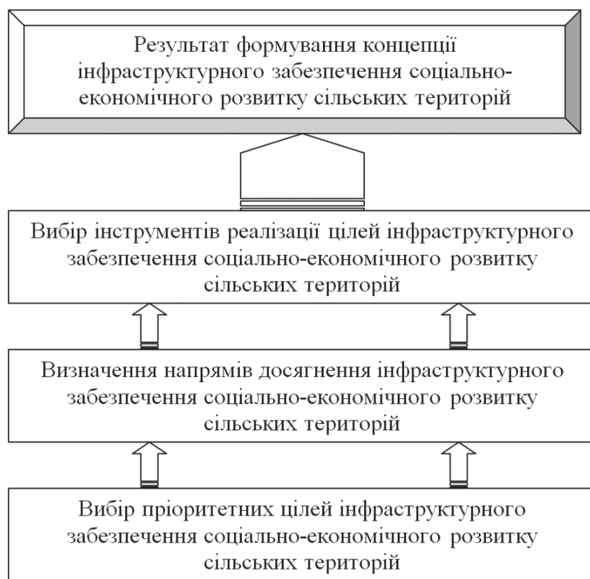
Рис. 1. Етапи формування концепції інфраструктурного забезпечення соціально-економічного розвитку сільських територій

Під формуванням концепції інфраструктурного забезпечення соціально-економічного розвитку будемо розуміти взаємозалежну і взаємодіючу сукупність і послідовність дій суб'єктів господарювання, методів та інструментів регіональних і державних органів влади з метою реалізації поставлених цілей і програм транскордонного рівня. На нашу думку, цей процес має складатися з певних елементів (рис. 1).