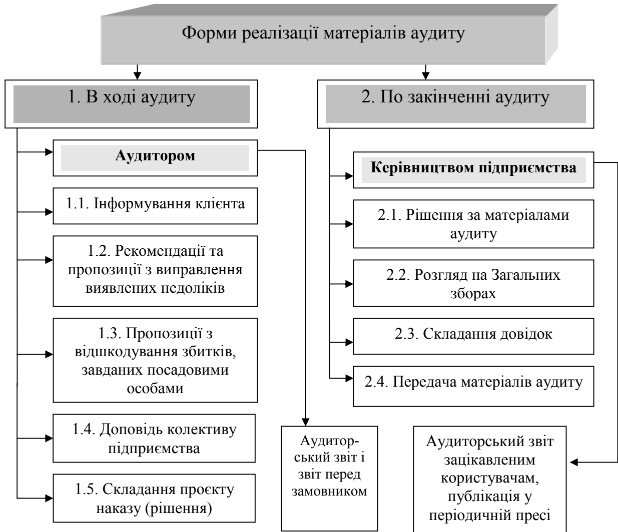
Рисунок 10.1 – Форми реалізації матеріалів аудиту

Юридичному відділу повинні бути передані акт перевірки з доданими до нього засвідченими копіями документів, що підтверджують завдані збитки; пояснення посадових осіб, на яких покладена відповідальність за завдані збитки; додаткові дані, які підтверджують правильність записів у матеріалах перевірки і обсяг завданих збитків; розрахунок матеріальної шкоди – за підписом керівника підприємства і головного бухгалтера; трудовий договір (контракт) із посадовими особами, які допустили правопорушення, і