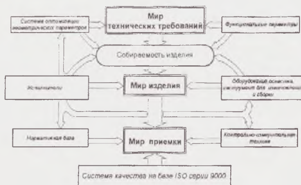
Рис.2. Структурные связи системы обеспечения геометрических параметров изделия Fig. 2. Structural connection system for geometrical parameters of the product

Формирование предполагаемого уровня взаимозаменяемости осуществляется на основе стандартов, регламентирующих геометрическую точность поверхностей.