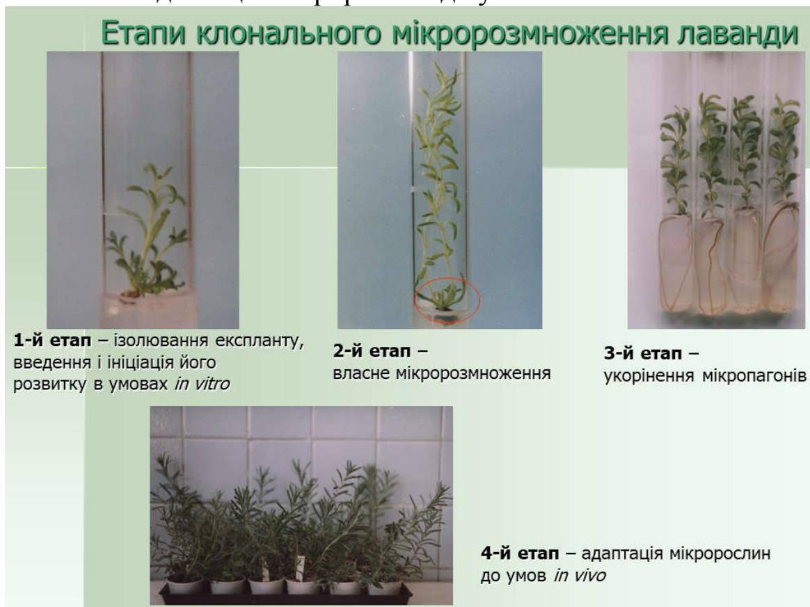
Рисунок 3 – Етапи клонального мікророзмноження рослин (на прикладі лаванди вузьколистої)

4-й етап – адаптація мікророслин до умов in vivo .