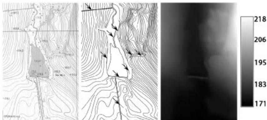
а) фрагмент топографічної карти М 1:10000