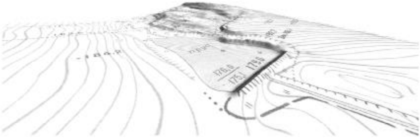
Рис.3. Перспективний 3d-вигляд драпованої топографічною картою ЦМР ( \omega=60 )

Обов'язковою умовою є введення у картографічну ЦМР додаткових 3d-поліліній дна каналів, струмків та річок (хоча це не обумовлено вимогами стандарту). Спроба такого поліпшення на прикладі водовідвідного каналу (рис. 1б, вверху зліва), показала, що якість результуючої ЦМР різко дисонує з тими ділянками, де таке вдосконалення не проводилося. За такого варіанту подальший гідрологічний аналіз дозволяє отримувати набагато точніші результати як у формі, напрямках, силі потоків води, так і дослідженні місць можливої акумуляції наносів. Це має першочергове значення при плануванні та організації протиерозійних заходів.