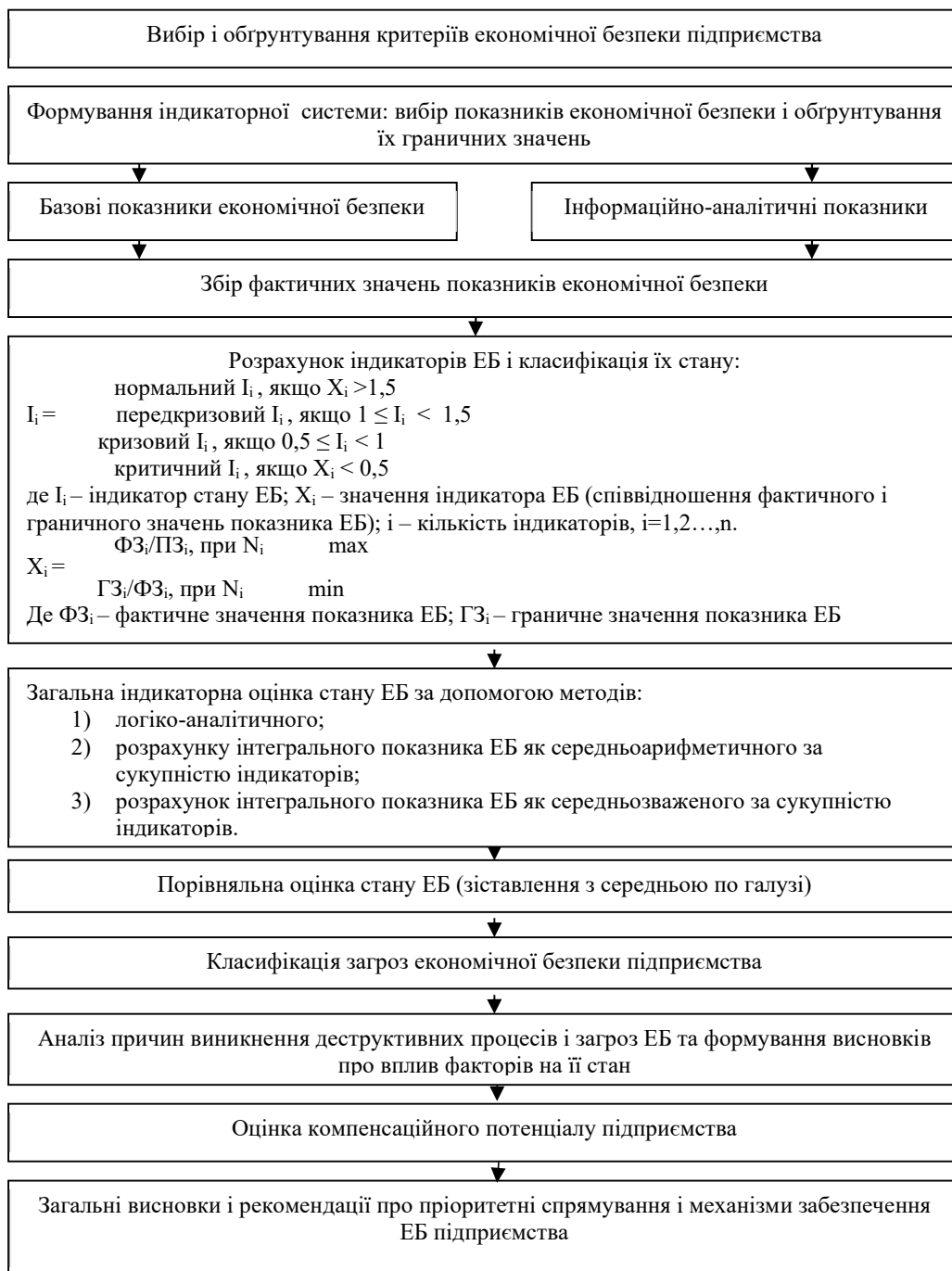
Рисунок 2 – Алгоритм застосування методики діагностики станів економічної безпеки підприємства

нормальний, передкризовий, кризовий і критичний. Стан економічної безпеки підприємства при використанні логіко-аналітичного методу оцінюється як: нормальний, коли індикатори економічної безпеки перебувають в межах граничних значень.