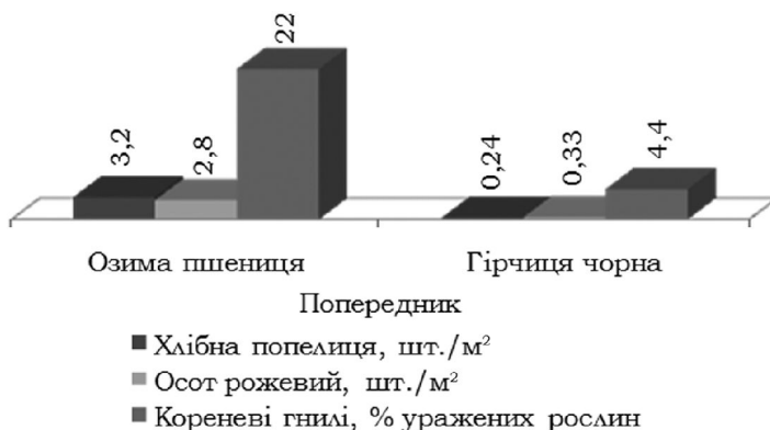
Рис.2. Фітосанітарний стан посіву пшениці озимої залежно від попередника (ФГ «Лію», Каланчацький район Херсонської області, дані за 2008-2009 рр.)

Агробіологічні особливості культури (насамперед її скоростиглість) дають можливість після її збирання якісно підготувати ґрунт для вирощування у наступному полі сівозміни пшениці озимої, а фітомеліоративні властивості (пригнічення розповсюдження типових для агроекологічної зони бур'янів, у першу чергу таких шкодочинних як осот рожевий, розпушення орного шару ґрунту) зумовляють радикальне покращення фітосанітарного стану агрофітоценозу, що позитивним чином позначається на врожайності ведучої культури зони.