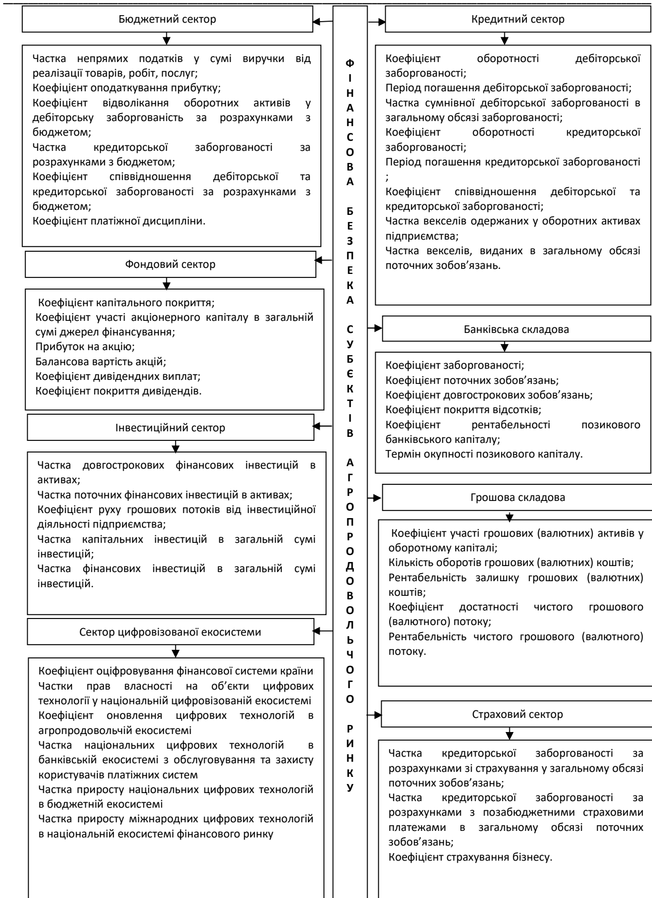
Рисунок 2 – Складові визначення фінансової безпеки суб'єктів агропродовольчого ринку