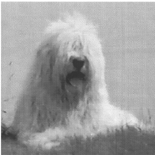
Рис. 3. Внешний вид головы

нее, тем лучше) при этом цвет радужной оболочки и глазного яблока по тону почти не отличаются. Глаза — круглые, средней величины, миндалевидного разреза, прямо и достаточно широко поставлены. Веки сухие, плотно прилегают, имеют полную, черную и глубокую обводку.