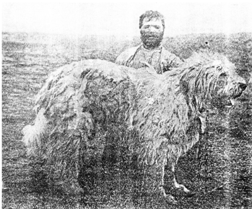
Рис. 1. Южнорусская овчарка начала XIX века

того, что покрыты густой и длинной псовиной, кажутся тумбами, на которые поставлено туловище собаки. Псовина на всем теле, не исключая ног, имеет сходство с овечьим (грубошерстным) руном и такое же свойство сваливаться войлоком. Все туловище густо обрастает длинной, достигающей 1/2 аршина и более псовиной, которая очень обильна, густа, но не шелковиста. Покрывает все туловище, ноги, кроме переносицы, где она короткая. Окрас псовины белый”.