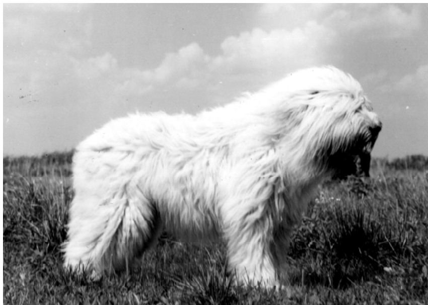
Рис. 2. Современный вид южнорусской овчарки

породы можно представить таким образом: южнорусская овчарка — выше среднего роста, эффектная, крепкая собака. При взгляде на нее создается впечатление силы и отваги, уверенности и благородства, гармоничности сложения и красоты. Сложная структура шерстного покрова — космы, и его особенное распределение на статях, создают силуэт с приятными, округлыми линиями и формируют образ рациональной и медлительной собаки, даже беззащитной. Типичная для породы тактика поведения — необходимость для безупречного исполнения своих обязанностей. За внешностью — твердый характер. Это неподкупная, очень внимательная и сообразительная собака. Ее реакция на малейшее проявление агрессии молниеносна и неординарна, в борьбе с противником она активна, изобретательна и беспощадна. Наряду с этим, южнорусская овчарка, очень послушна и преданна своим близким.