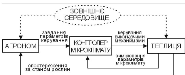
Рис. 1. Структура традиційної ситми керування теплицею

Традиційні системи керування, які часто використовуються сьогодні (рис. 1), базуються на знаннях або досвіді сільгоспвиробника. Агроном, керуючись типом рослин, їх станом та етапом вирощування, визначає параметри мікроклімату теплиці, які встановлюються як завдання для системи керування мікрокліматом. Сучасні системи керування тепличних комбінатів можуть налічувати до 150 різних параметрів [4], які агроном має визначити, і поставити завдання кліматичному комп'ютеру по досягненню відповідного режиму за допомогою наявних технічних засобів – виконавчих механізмів системи керування. Спостереження за станом рослин та довгострокові погодні прогнози можуть вплинути на рішення сільгоспвиробника по зміні параметрів в процесі вирощування.