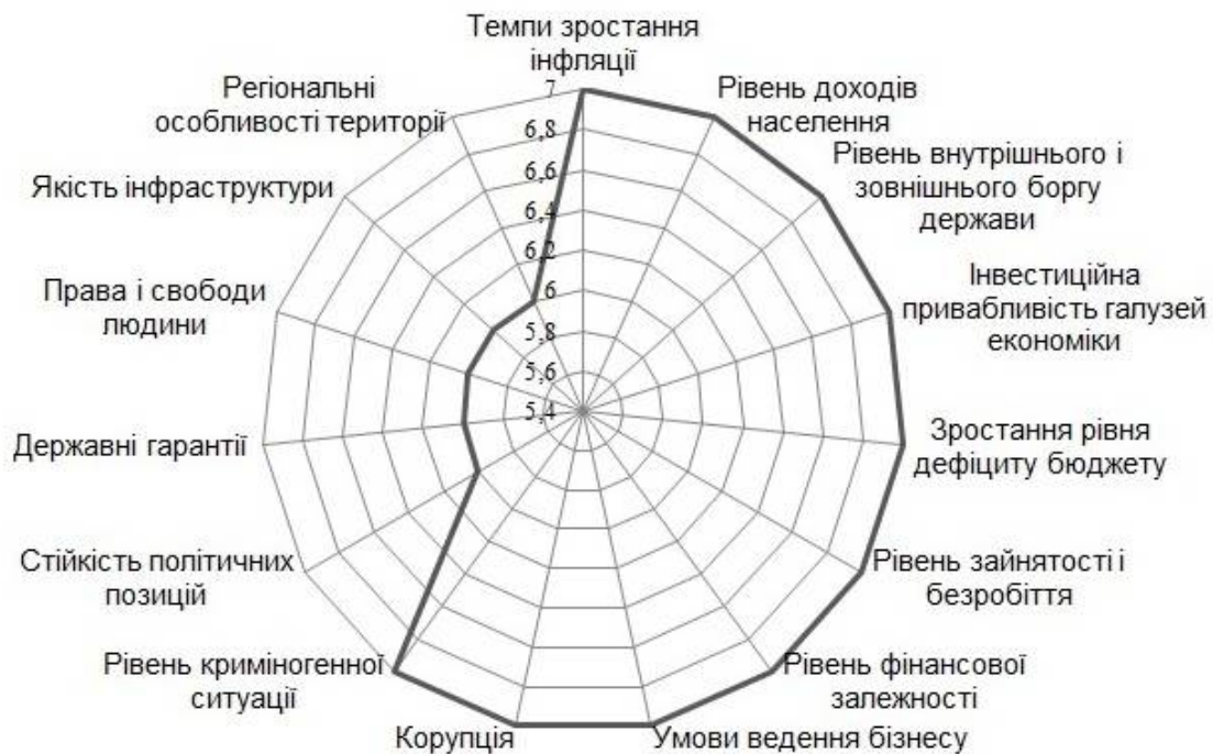
Рис. 2. Пріоритетність чинників впливу за результатами експертної оцінки (другий етап дослідження)

сферах економіки держави та на усіх агрегованих ринках, що потребує їхньої постійної оцінки та запровадження відповідних дій з метою нейтралізації негативних тенденцій, своєчасної адаптації на усіх рівнях управління.