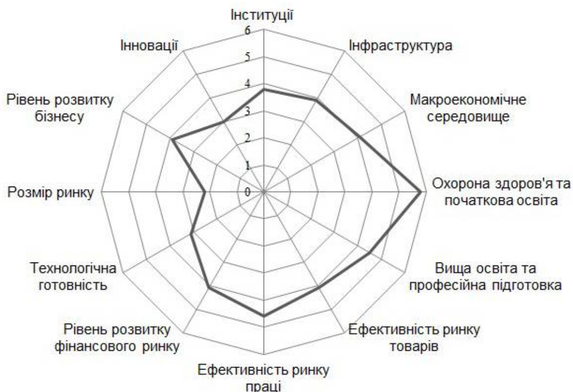
Рис. 3. Пріоритетність складових індексу глобальної конкурентоспроможності регіонів України за середнім значенням (третій етап дослідження)

тровській, Львівській та Київській областях. Найменші позиції посідають Житомирська, Херсонська та Кіровоградська області. Регіональні особливості є вагомою передумовою у прийнятті рішень та повинні бути зорієнтовані на основні макроекономічні категорії: чисельність населення регіону, валовий регіональний продукт, валовий регіональний продукт у розрахунку на одну особу, питома вага регіону у формуванні ВВП країни (рис. 3).