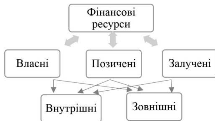
Рисунок 3 – Склад фінансових ресурсів сільськогосподарських підприємств

Вибір оптимального співвідношення між власними, позиченими та залученими коштами є важливим завданням управління фінансовими ресурсами. Надмірна залежність від зовнішніх джерел може підвищити фінансові ризики, тоді як обмежена залученість зовнішніх ресурсів може стримувати розвиток підприємства. Ретельний аналіз вартості та доступності різних джерел фінансування дозволяє сформулювати збалансовану структуру капіталу. (рис 3).