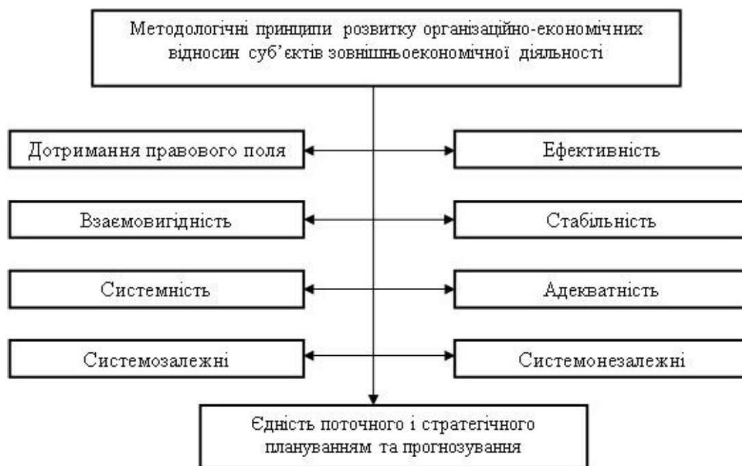
Рис. 2. Методологічні принципи розвитку організаційно-економічних відносин суб'єктів зовнішньоекономічної діяльності

ня суб'єктів зовнішньоекономічної діяльності. Методологічні принципи розвитку організаційно-економічних відносин аграрних підприємств суб'єктів зовнішньоекономічної діяльності зосереджено на рисунку 2.