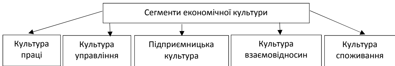
Рисунок 3 – Сегменти економічної культури

Сегменти економічної культури наведено на рис. 3..