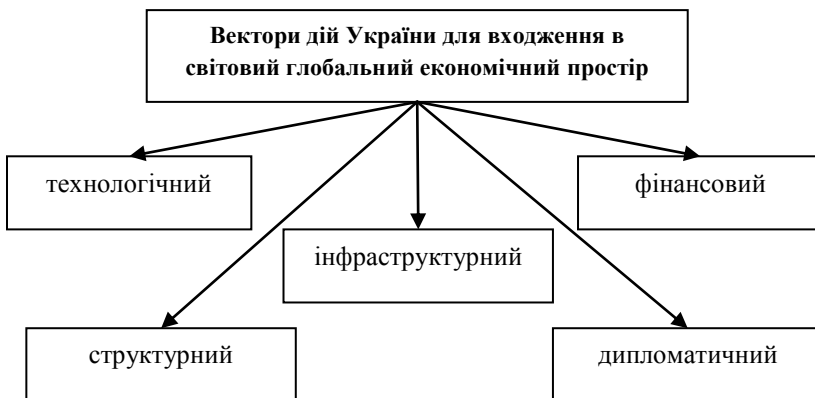
Рис. 1. Різновекторність дій України для входження в світовий глобальний економічний простір*

Враховуючи виклики сьогодення, на нашу думку, Україна має діяти різновекторно у межах напрямів, енаведених на рис. 1.