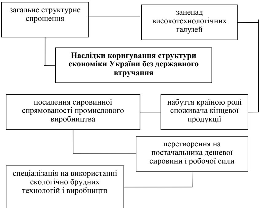
Рис. 3. Ланцюг наслідків коригування структури економіки України без державного втручання*

Наслідки коригування структури недостатньо розвинутої національної економіки, якою є економіка України, лише ринком (без державного втручання), представлені на рис. 3.