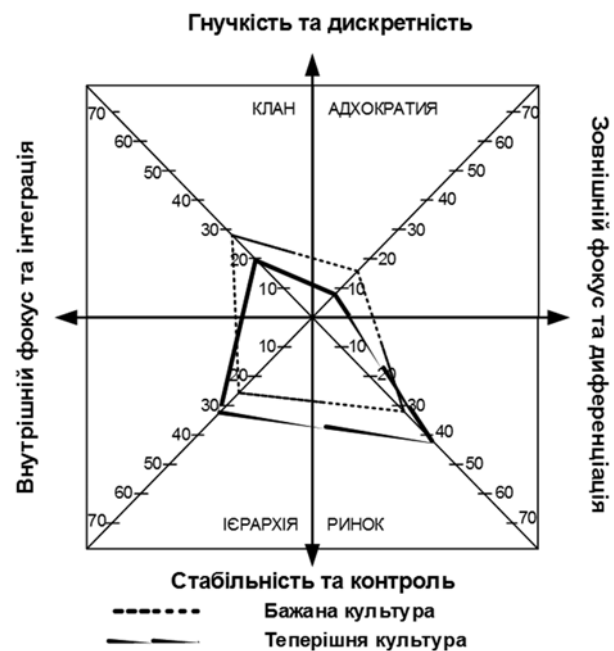
Рис. 1. Рамкова конструкція загального стану ОК сільськогосподарського підприємства ПАТ «Зелений Гай», Вознесенського району, Миколаївської обл.

Сила культури. Найбільш сильний у підприємстві ринково-бюрократичний тип культури, оскільки воно спрямоване на результати, виконання поставлених цілей, контроль, чітку організацію, підтримання планового ходу діяльності та стабільність.