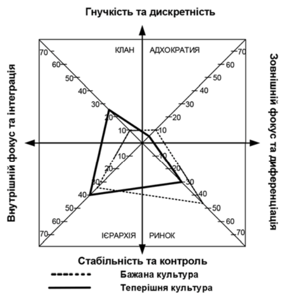
Рис. 2.6 Критерії успіху