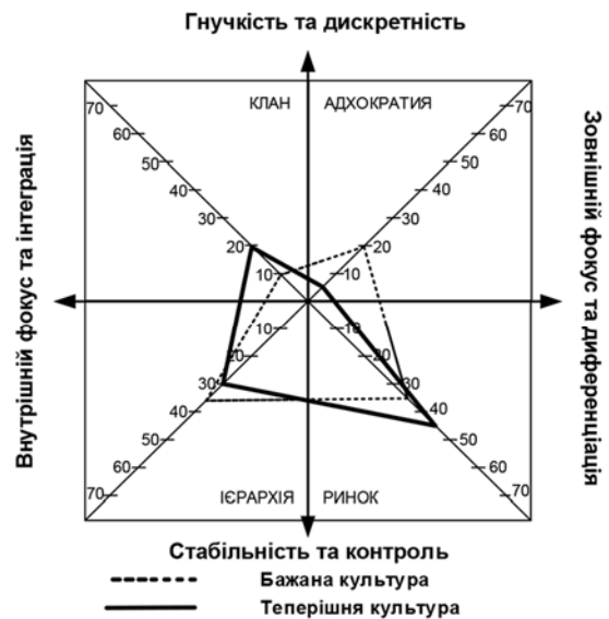
Рис. 2.2 Лідерство