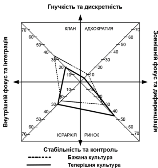
Рис. 2.5 Стратегічні цілі