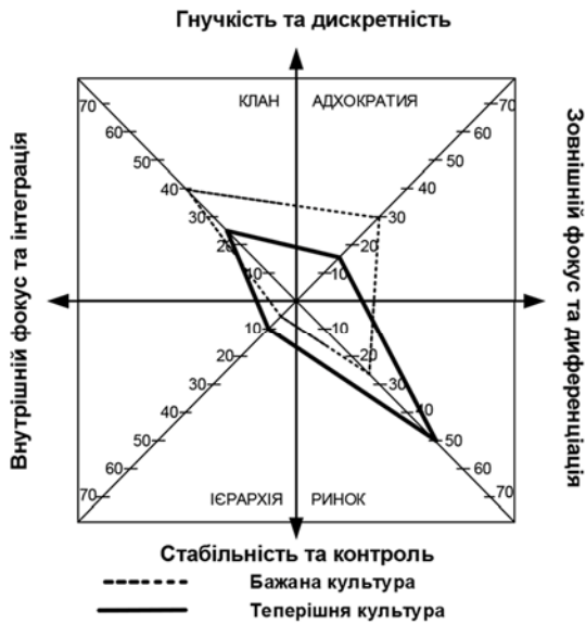
Рис. 2.1 Найважливіші характеристики ОК