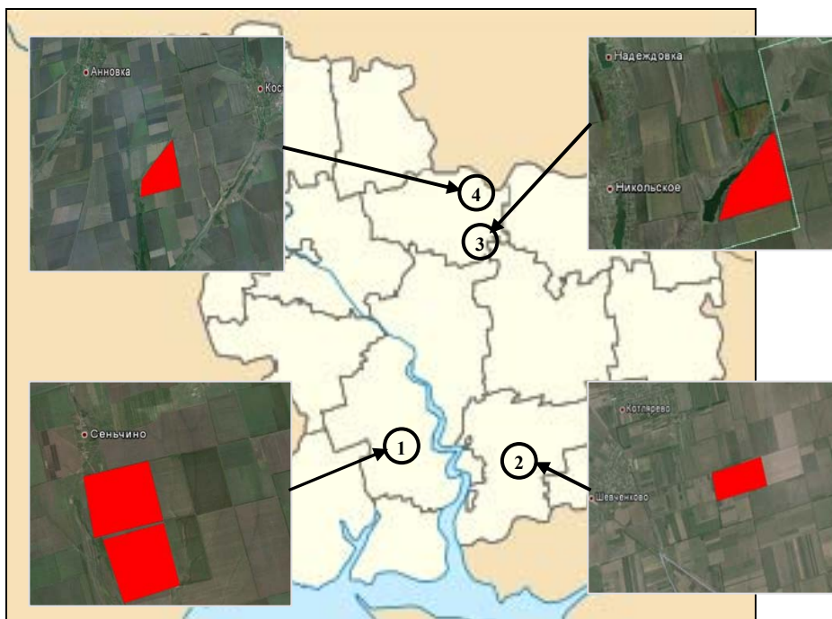
Рис. 1. Схема расположения опытных участков:

В (2–4) NIR – значение яркости ближнего инфракрасного канала, RED – значение яркости красного канала.