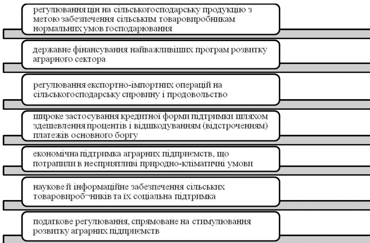
Рисунок 1 – Основні ланки регулювання і підтримки сільськогосподарських виробників в зарубіжних країнах

Досвід зарубіжних країн щодо підтримки сільськогосподарських виробників можливий для впровадження і в нашій країні, адже це необхідно для стабілізації галузі сільського виробництва, впровадження найкращих технологій, розвитку виробничої інфраструктури, захисту товаровиробника на внутрішньому ринку, стимулювання експорту сільськогосподарської продукції. Для економічно розвинутих країн характерним з боку держави є використання законодавчо та організаційно визначених довгострокових бюджетних заходів. Досвід країн Європейського Союзу, США, Канади, країни північної Європи свідчить про накопичення значного інструментарію державного регулювання і підтримки сільськогосподарського виробництва в ринковій економіці. Його узагальнення дає змогу виділити основні ланки (важелі) такого регулювання (рис. 1).