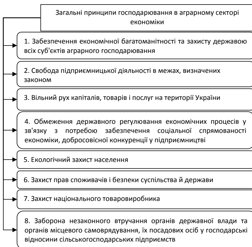
Рисунок 2 – Загальні принципи господарювання в аграрному секторі економіки

суб'єктів виробничо-господарської діяльності можна виділити та розглянути основні принципи господарювання в аграрному секторі економіки (рис. 2).