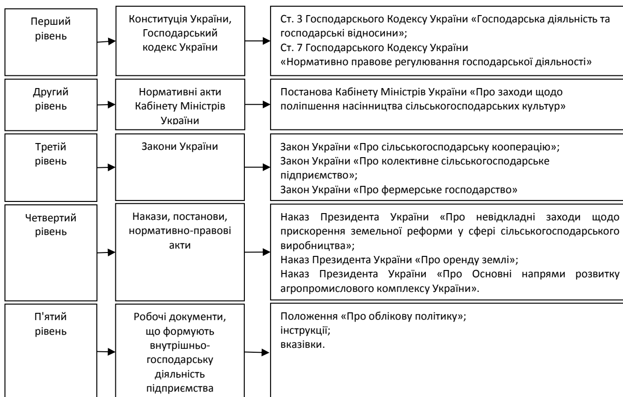
Рисунок 4 – Рівні нормативного забезпечення виробничо-господарської діяльності сільськогосподарських підприємств

Так, дане питання регулюється відповідним рядом нормативних документів (рис. 4).