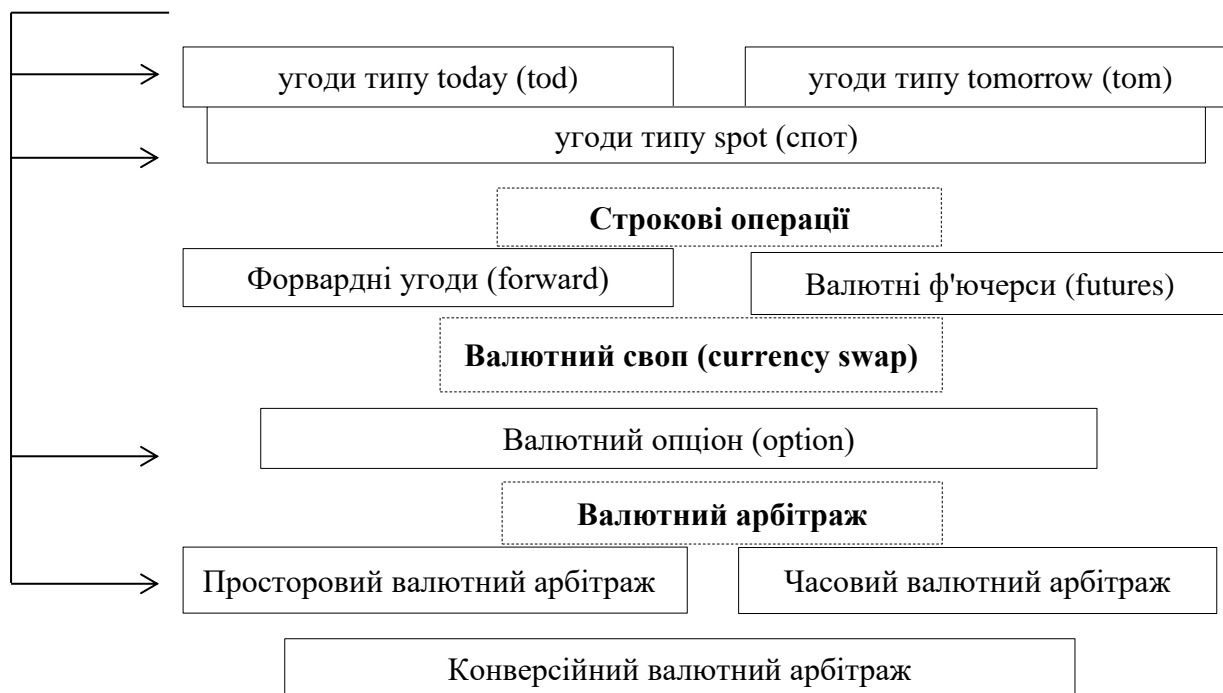
Рисунок 1 – Класифікація конверсійних валютних операцій

Конверсійні операції охоплюють широке коло банківських операцій і за своєю сутністю є угодами агентів валютного ринку з обміну обумовлених сум грошової одиниці однієї країни на валюту іншої країни за узгодженим курсом на визначену дату.