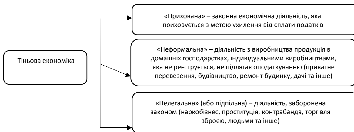
Рисунок 1 – Структура тіньової економіки