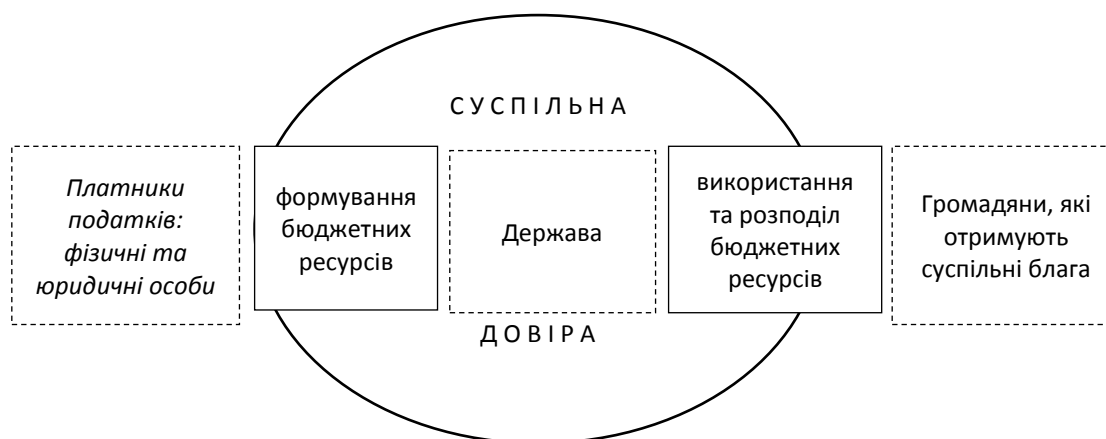
Рисунок 2 – Взаємозалежність суб'єктів та об'єктів фіскального простору держави в умовах формування суспільної довіри

Взаємозв'язок між суб'єктами та об'єктами фіскального простору представлено на рис. 2.