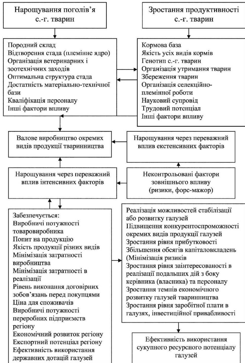
Рис. 2. Взаємозв'язок факторів для реалізації стратегії стабілізації (розвитку) галузей тваринництва підприємствами сільських територій

Отже, для забезпечення реалізації стратегії стабілізації та розвитку тваринництва передбачено ряд дієвих заходів, але всі вони повинні реалізовуватися в кожному під-