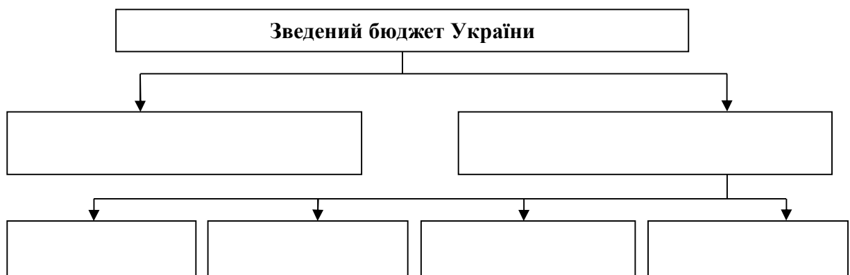
Рисунок 1.1 – Структура бюджетної системи України

Завдання 1.1. Схематично на рисунку 1.1 необхідно представити та охарактеризувати структуру бюджетної системи України