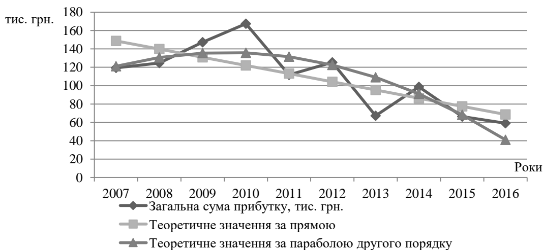
Рисунок 7.1 – Визначення тенденції в зміні загальної суми прибутку готельно-ресторанного комплексу «Сузір'я»