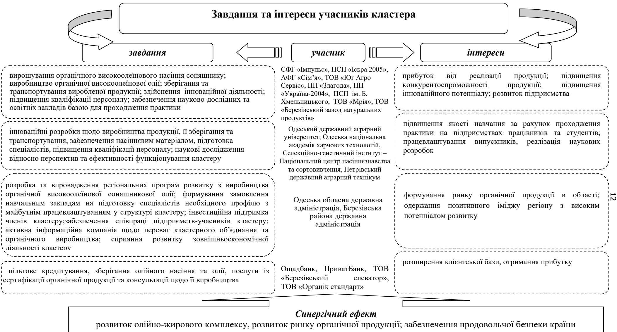
Рисунок 2 – Завдання та інтереси учасників регіонального кластера з виробництва органічної високоолеїнової соняшникової олії в Березівському районі Одеської області