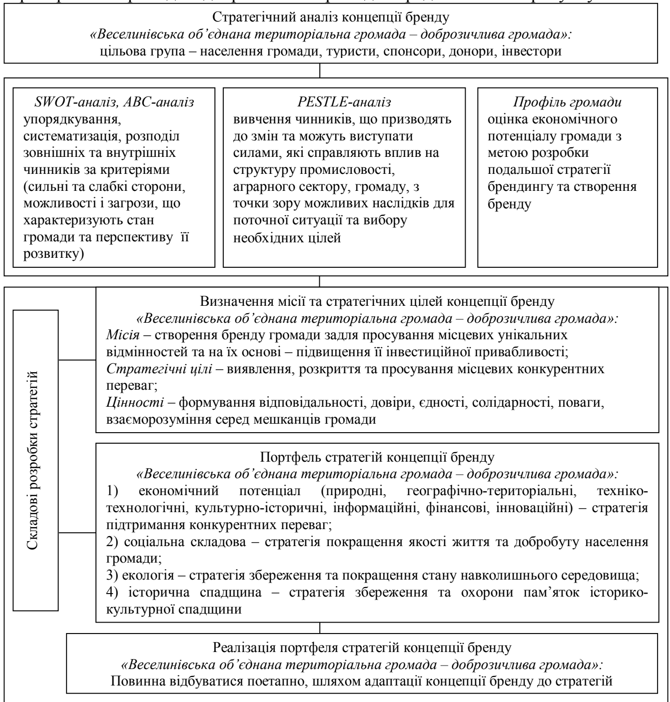
Рисунок 3 – Модель концепції бренду «Веселинівська об'єднана територіальна громада – доброзичлива громада»

розробка стратегічного плану із просування; реалізація та оцінка ефективності сформованого бренду. Модель концепції бренду «Веселинівська об'єднана територіальна громада – доброзичлива громада» представлено на рисунку 3.