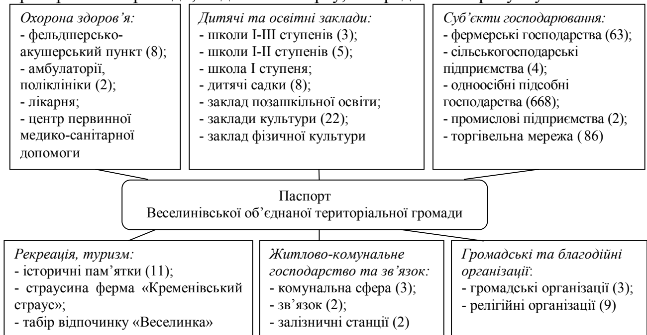
Рисунок 2 – Паспорт Веселинівської об'єднаної територіальної громади

Веселинівська об'єднана територіальна громада – передова енергетично незалежна громада, має достатні природні ресурси та розвинену інфраструктуру для комфортного проживання її мешканців. Основні кількісні показники соціально-економічного розвитку Веселинівської об'єднаної територіальної громади, згідно її паспорту, зосереджено на рисунку 2.