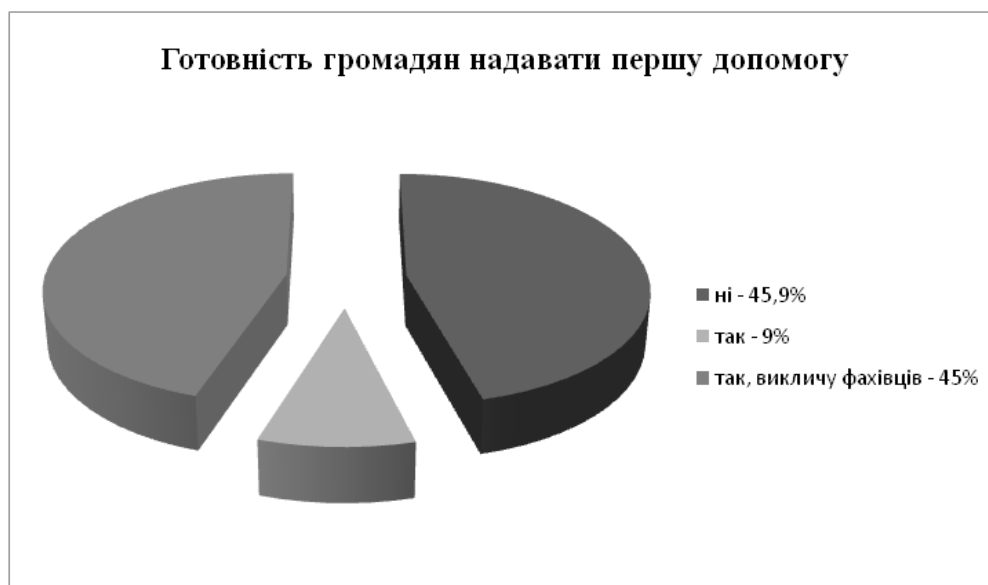
Рисунок № 3. Готовність громадян надавати першу допомогу

За результатами досліджень було встановлено, що рівень обізнаності навичок першої допомоги серед студентів та викладачів НУК доволі низький, що також свідчить про низький загальний рівень всієї громади міста.